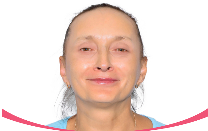
До имплантации зубов