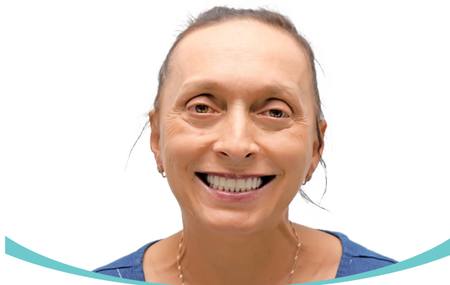
Сразу после имплантации зубов